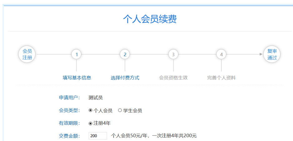
图 5 延长个人会员有效期

如果姓名、会员证号等信息输入有误，系统将提示身份验证失败（图 6）。请您确认相关信息后，再次提出申报。