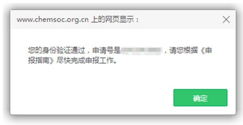
图 3 身份验证成功并获得申请号

如果点击“验证并开始申请”后，页面显示“已过有效期”（图 4），表示申请人的会员身份已经过期。可点击蓝色字体“延长会员有效期”，先缴纳会员费，成为有效个人会员后，再行申报（图 5）。