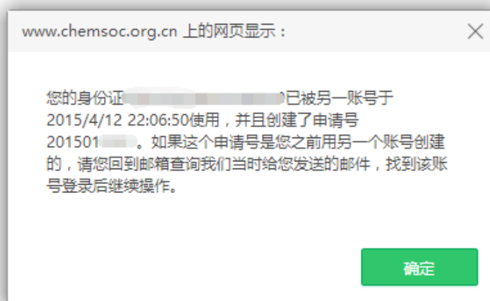
图 7 重复申报奖励提示页面

提示: 非中国化学会会员需先办理入会手续, 成为个人会员后, 再申报学会奖励。忘记会员证号的申请人可登录个人会员中心, 查看会员证号。如果忘记登录密码, 可通过注册时的 Email 和姓名重置密码。