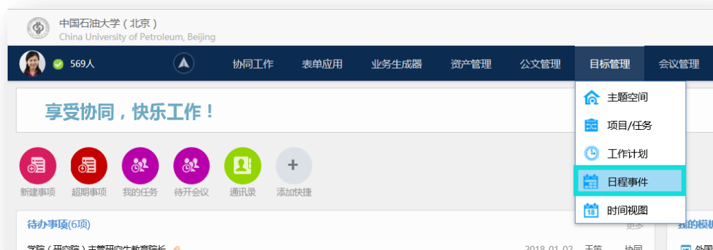
建立日程事件菜单位置

点击新建创建日程事件。输入事件相关信息，如：事件标题、起止时间、状态、重要程度等；勾选提醒，系统会在事件开始时通知提醒；点击【高级设置】按钮出现高级设置页面，可以设置事件的完成率等信息。