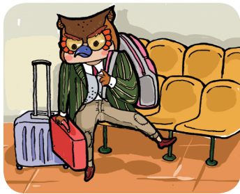
外出旅行要看管好个人物品