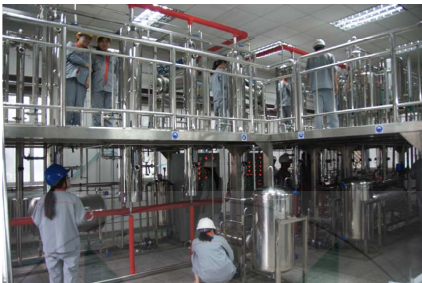
图 2 一体化综合流程实验平台