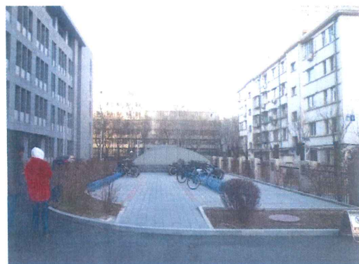
透水砖铺装及美化绿化