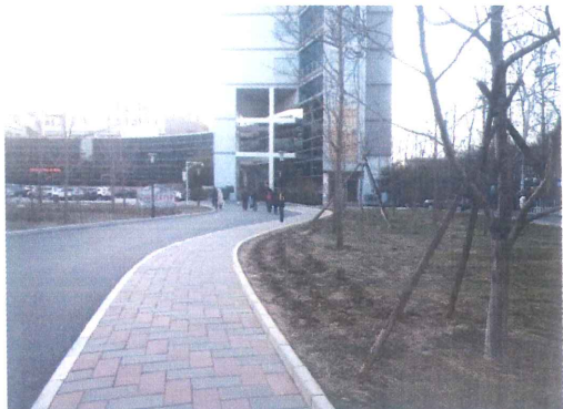
透水砖铺装及美化绿化