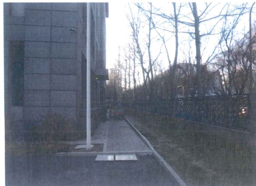
透水砖铺装及美化绿化