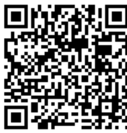
中国石油大学北京医院