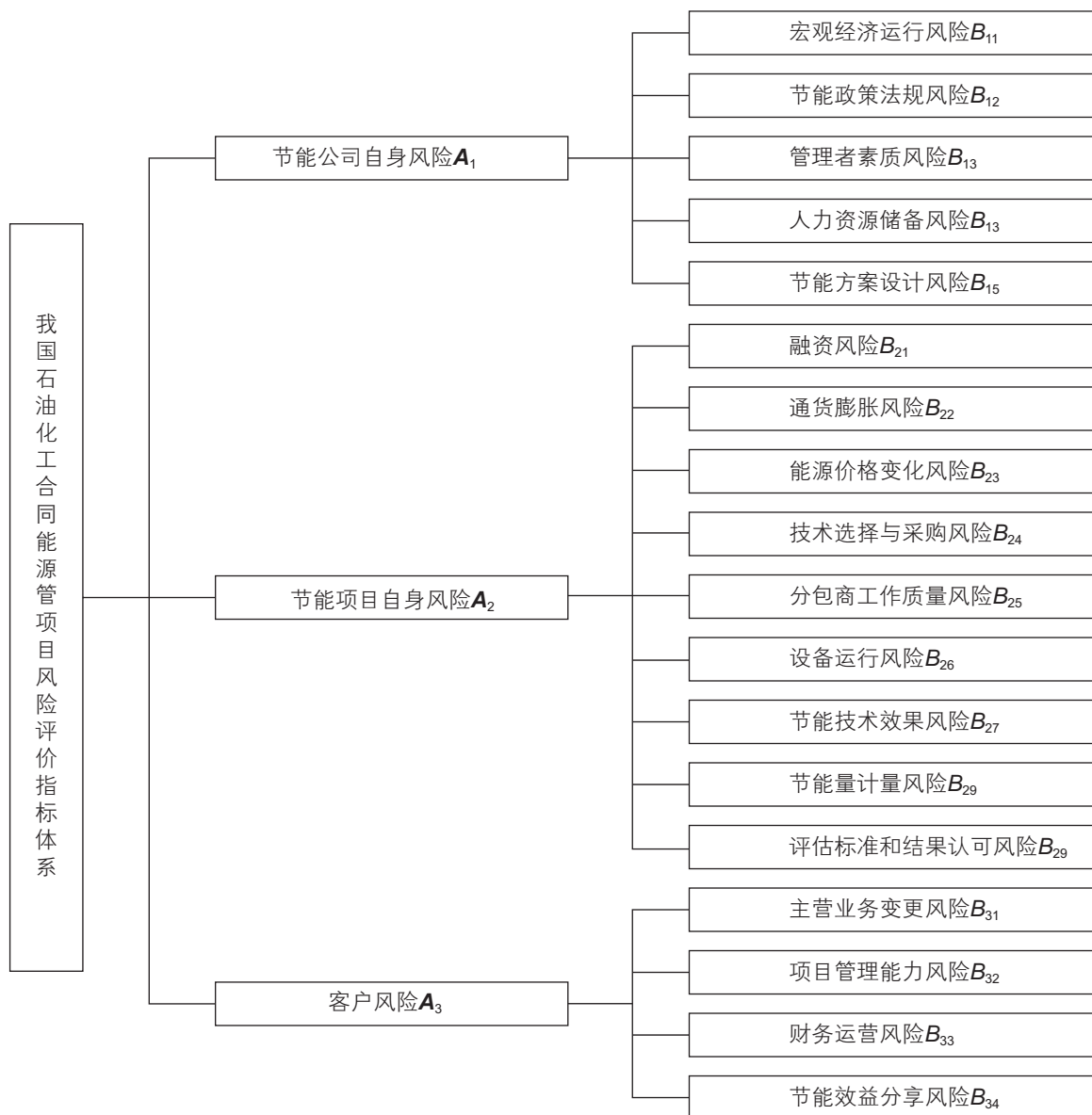
图2 我国石油化工合同能源管理项目风险评价指标体系 Fig. 2 Risk index system of China's petrochemical EPC project